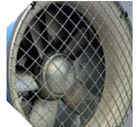
Detalle del ventilador instalado en el cañón del fog industrial Elefante