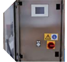
Cuadro de mandos de la instalación industrial de abatimiento de polvos Elefante