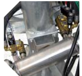
Detalle del grupo neumático de bombeo.