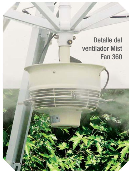
Detalle del ventilador Mist Fan 360

El "Ombrellone" 360° se puede adquirir completo o de forma modular. Es ideal para ser posicionado en jardines y terrazas de viviendas, restaurantes, hoteles, etc.