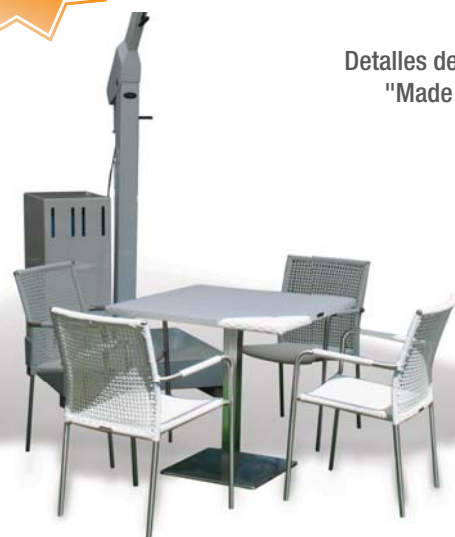
Detalles del diseño "Made in Italy"