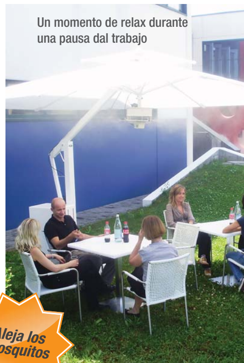
Un momento de relax durante una pausa dal trabajo

Mesa con columna central en acero inox AISI 304 y superficie en resina sintética (blanca)