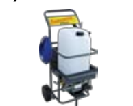
KIT DESINFECCIÓN MANUAL