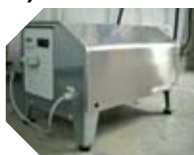
KIT MÓDULO BOMBEANTE