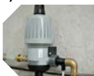
KIT DOSIFICACIÓN DESINFECTANTE detalle de la bomba dosificadora