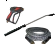
KIT PARA EL LAVADO DE VEHÍCULOS