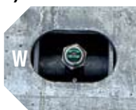
KIT DESINFECCIÓN RUEDAS detalle de la boquilla nebulizadora