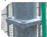
KIT ARCO DESINFECCIÓN ARCA detalle de la conexión entre las columnas