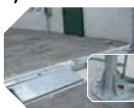
KIT TARIMAS detalle del basamento del arco de desinfección