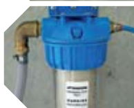
KIT MÓDULO BOMBEANTE detalle del filtro entrada agua

20 bar, 21 l/min. Módulo con base de acero cincado y cubierta en acero inox, completo de: • motor eléctrico de 3x400V-1450 Rpm, • Bomba a.p. 150 bar, 21 l/min, con cingüeñal, 3 pistones de cerámica y culata en latón. • Válvula de regulación. • Válvula de seguridad. • Manómetro. • kit filtro de 20" y 10 mesh. • Fotocélulas para el funcionamiento automático. • Indicador intermitente de funcionamiento. • Dispositivo ON-OFF de mando manual con kit antigoteo.