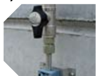
KIT DE CONEXIÓN detalle de la válvula de intercepción línea